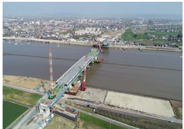
筑後川橋(仮称) 建設現場