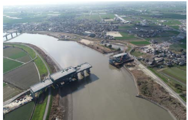
早津江川橋(仮称) 建設現場