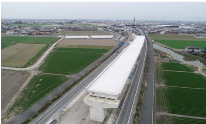
大川高架橋(仮称) 建設現場