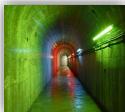
▲監査廊をライトアップしました