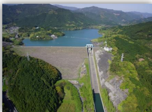
▲寺内ダムはロックフィルダムです