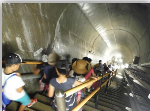
▲ダムの内部の階段を下りて、ダムの中を見学します