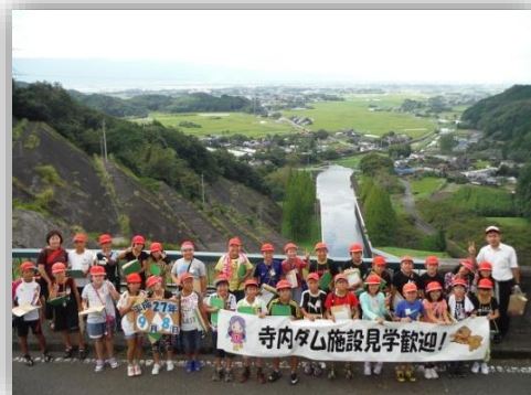
▲ダムの上からは、遠くまで見渡せます

【見学は、平日 9:00～12:00、13:00～16:00 (土・日曜、祝日、年末・年始を除く。)] 大雨等によって、出水対応等で出来ない場合もあります。