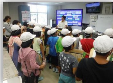
▲ダムの操作室では、寺内ダムについて詳しく説明します