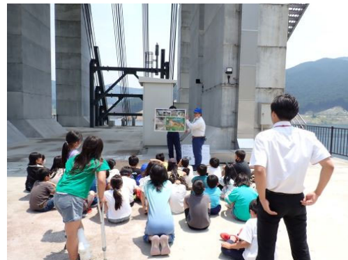
▲小石原川ダムの見学風景