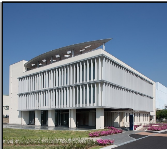
ビジターセンター