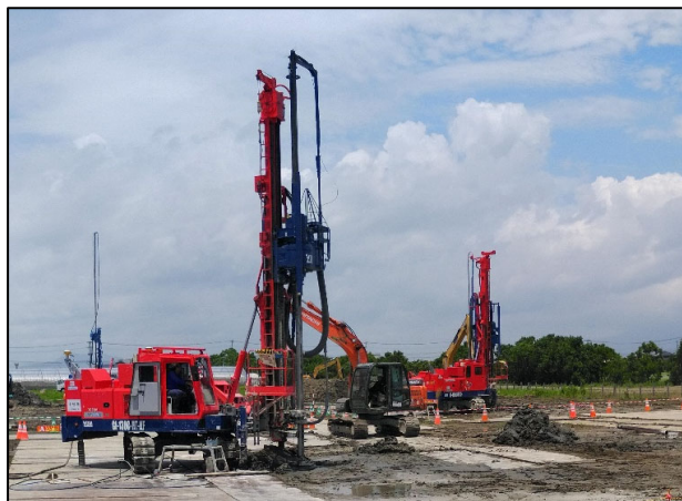
地盤改良工事現場