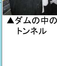
▲ダムの中のトンネル

佐賀県を代表する一級河川・松浦川は、流域の年間降水量が全国平均よりも多く、しかも雨の降る時期が夏に集中する傾向にあります。そのため大雨になれば川が増水して水害発生の心配がありました。そこで水害の軽減を主な目的として建設されたのが厳木ダムです。