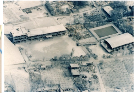
焼失した旧大野木場小学校