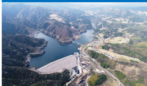
ななせダム全景（令和2年3月撮影）