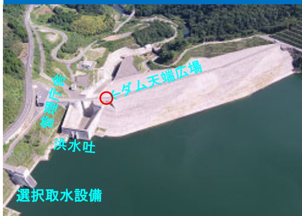
ななせダム上流側上空からの近景