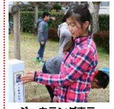
ジャカランダ表示