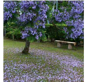
石合公園のジャカランダ 2014. 6. 11撮影