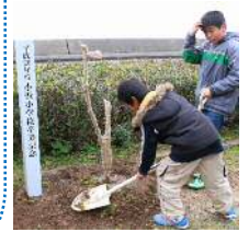
木の周りを盛り上げる