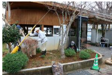
ジャカランダ2本を掘る