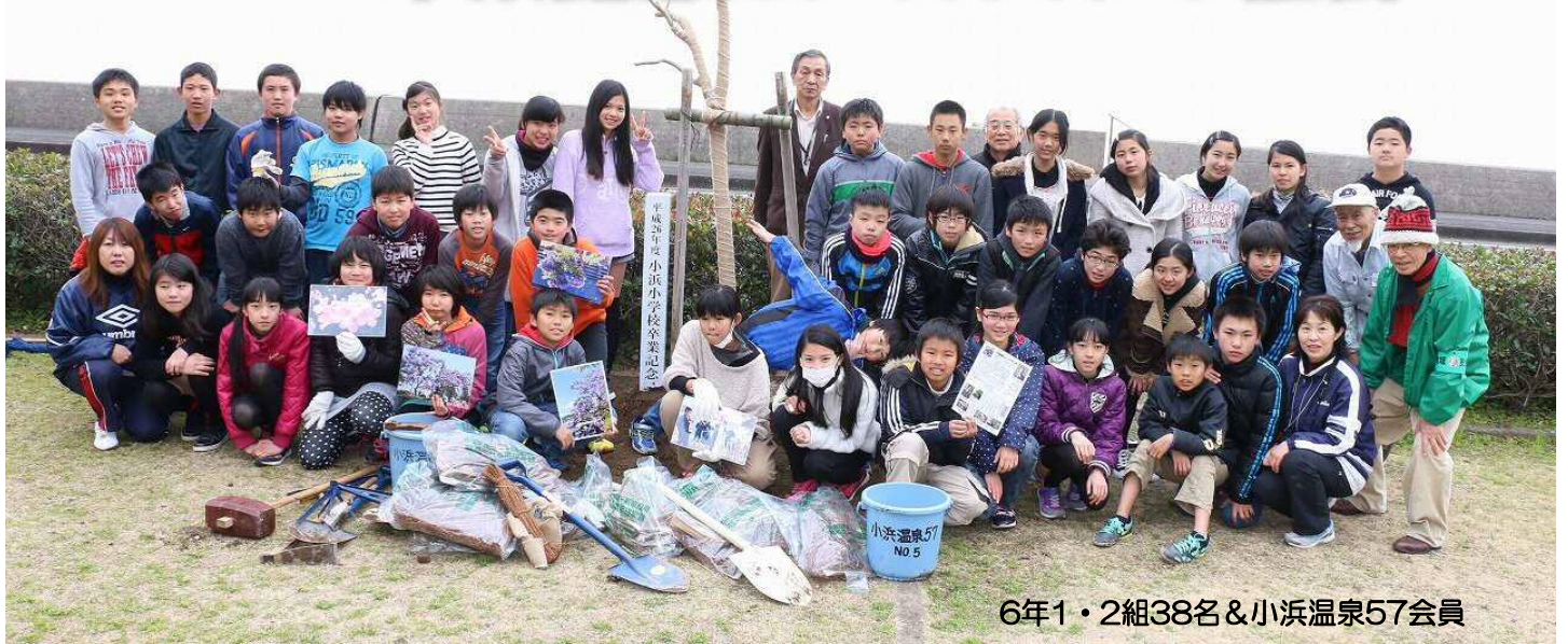
6年1・2組38名&小浜温泉57会員