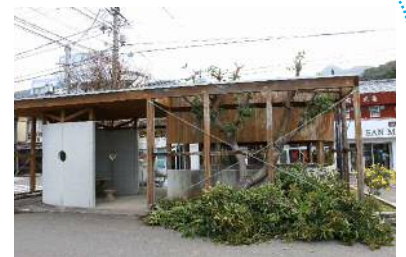
剪定して休憩所もスッキリ！