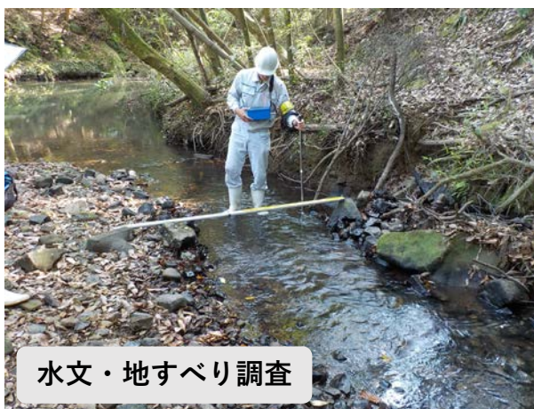
水文・地すべり調査