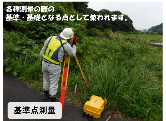
各種測量の際の 基準・基礎となる点として使われます。