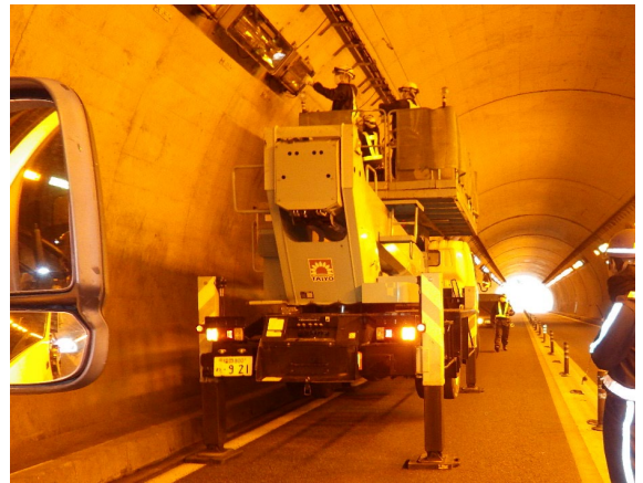
＜トンネル照明灯具取替工事＞