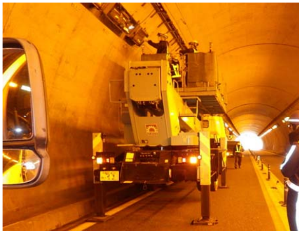
<トンネル照明灯具点検・取替工事>