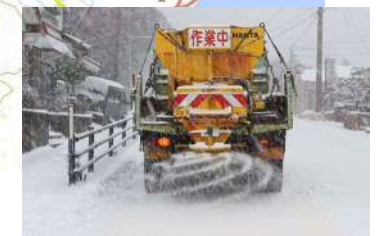
融雪剤散布作業状況