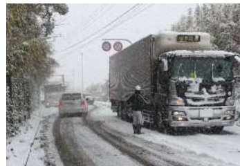
スタック車両の状況 (2016年1月)