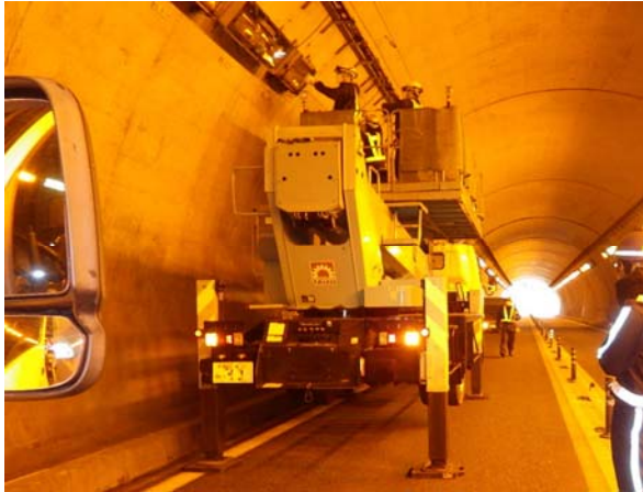
<トンネル照明灯具点検・取替工事>