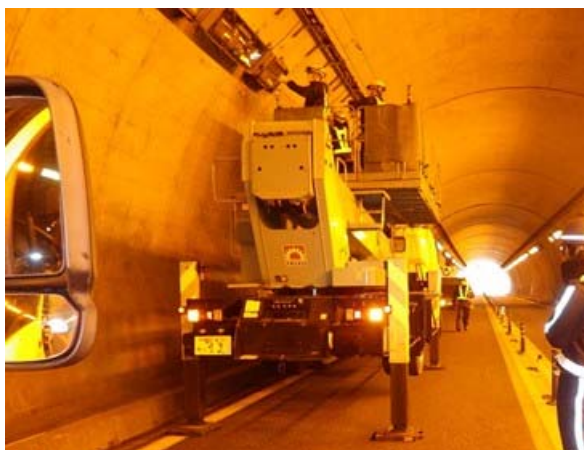
＜トンネル照明灯具点検・取替工事＞