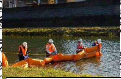
③【オイルフェンス敷設等訓練】 河川の両岸にオイルフェンスを設置し、オイル吸着マットを散布し油を回収する。