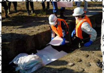
②【土のう積み訓練】 油が流出している水路に土のうを積み油の流出を防止し、オイル吸着マットを散布し油を回収する。