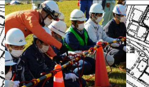
①【ロープ結索演習】 オイルフェンス設置時等の基本であるロープ結索の技術を習得する。