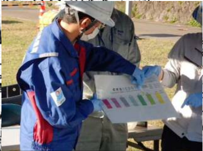
④【水質分析訓練】 水質を分析し、原因物の究明や汚濁状況の把握を行う。