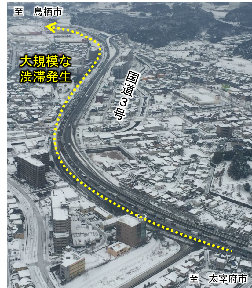
▲国道3号の渋滞状況 (福岡県筑紫野市上空)