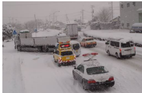
▲立ち往生車両の発生状況 (鳥栖市)