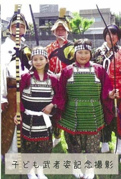
子ども武者姿記念撮影