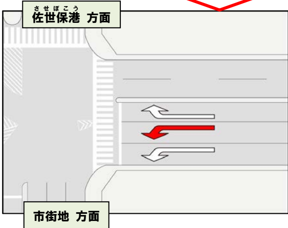
佐世保中央IC 左折レーンの渋滞状況