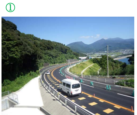
おぼまおんせんが 小浜温泉街方面を望む