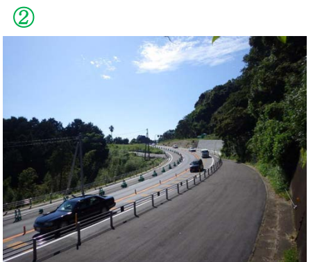
いさはや 諫早方面を望む