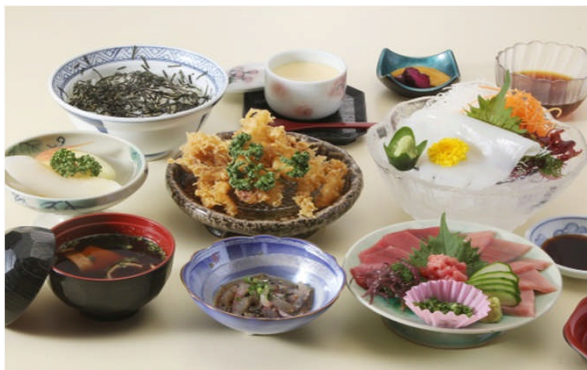
▲日本有数の”おさかな基地・松浦”で大満足の海鮮グルメを満喫♪