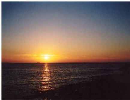
▲国立公園と西海橋にて夕陽の鑑賞