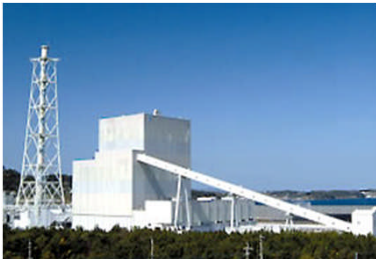
▲九州電力松浦発電所