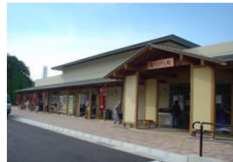
▲道の駅松浦海のふるさと館