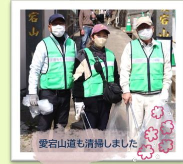
愛宕山道も清掃しました