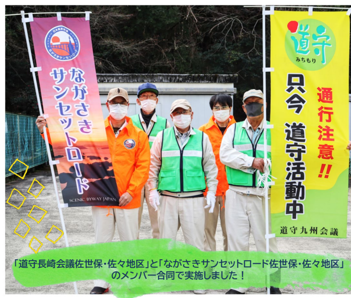
「道守長崎会議佐世保・佐々地区」と「ながさきサンセットロード佐世保・佐々地区」のメンバー合同で実施しました！