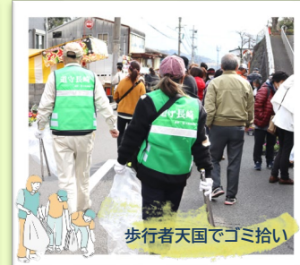
歩行者天国でゴミ拾い