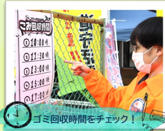
ゴミ回収時間をチェック！