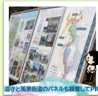
道守と風景街道のパネルも設置してPR