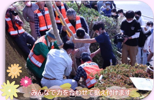
みんなで力を合わせて据え付けます

○3月10日のジャカランダ植樹ありがとうございました。ジャカランダの花言葉が名誉ということを知って、カッコいいなと思いました。ジャカランダが咲くのが楽しみです。