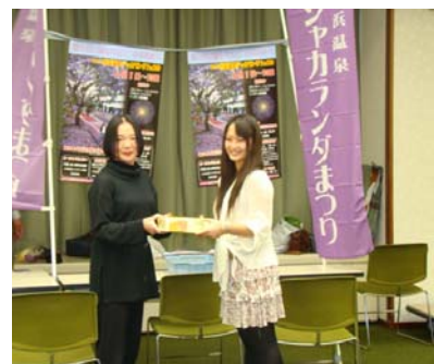
【惜しくも僅差の2位は「小浜温泉57」の皆さま】