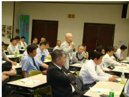
【参加者より活発な意見・質問が発言されました】