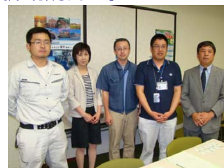
【長崎大学インフラ超寿命化センター】