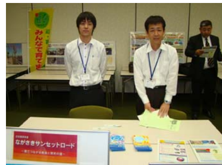
【風景街道「ながさきサンセットロード」のブース】