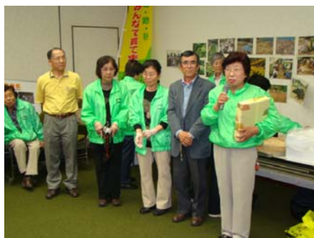
西海市大島町の「環境美化を考える会」の皆さんが栽培した元気野菜。【見事1位でした】