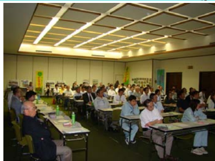
【会議の様子、今年も大勢の道守が参加】