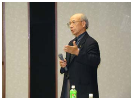
【宮田代表世話人挨拶】