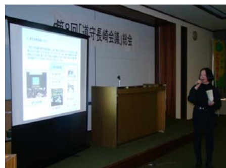
【阿野事務局長説明】