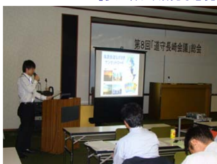
【風景街道の屋台紹介】