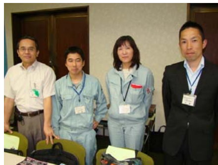
【佐世保市「道路アダプト事業」などのブース】