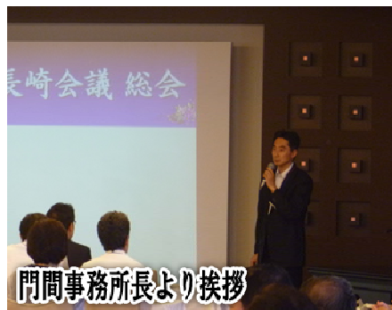
門間事務所長より挨拶