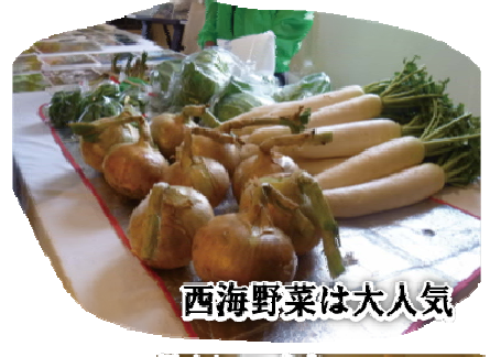
西海野菜は大人気