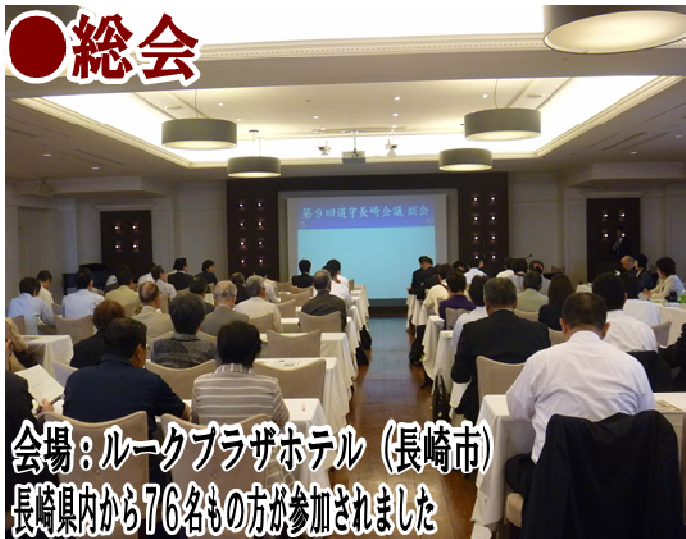
会場：ルークプラザホテル（長崎市） 長崎県内から76名もの方が参加されました