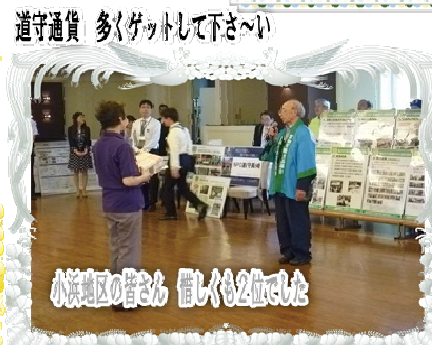
小浜地区の皆さん 借しも2位でした