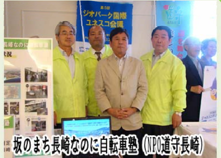
坂のまち長崎なのに自転車塾 (NPO道守長崎)