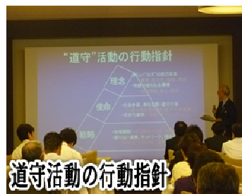
道守活動の行動指針