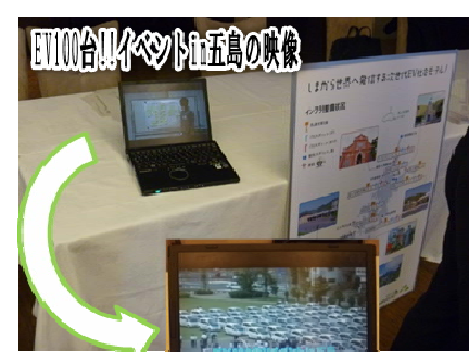
ENOV合川イベント五島の映像