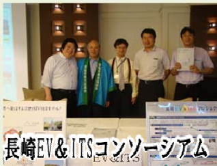
長崎EV&ITSコンソーシアム