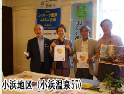
小浜地区 (小浜温泉57)