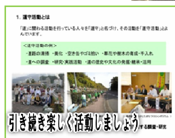
引き続き楽しく活動しましょう