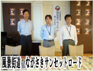
風景街道 ながさきサンセットロード