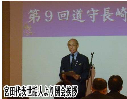
宮田代表世話人より開会挨拶