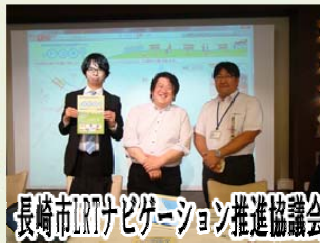
長崎市ITナビゲーション推進協議会