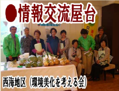
西海地区 (環境美化を考える会)

参加者の皆さんに日頃の活動を紹介し、活動のヒントを得てもらうのが情報交流屋台です。