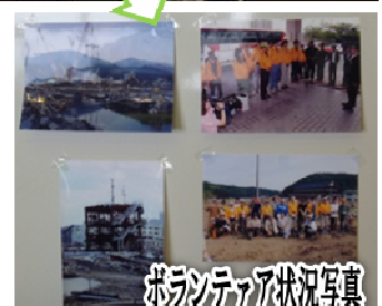
ボランティア状況写真