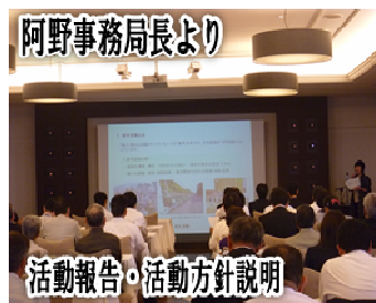
活動報告・活動方針説明