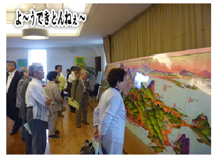
よ〜うできとんねえ〜