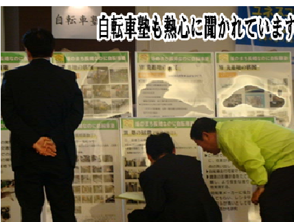
自転車塾も熱心に聞かれています