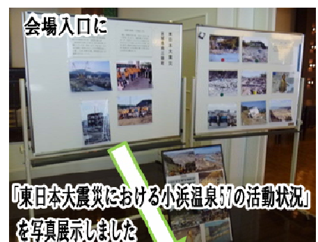
会場入口に 『東日本大震災における小浜温泉の活動状況』 を写真展示しました