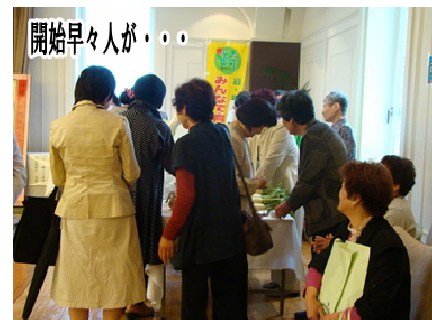
開始早々人が・・・