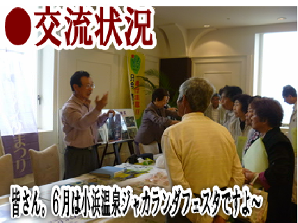
皆さん、6月は小浜温泉ジャガタのグリーンウィークです！