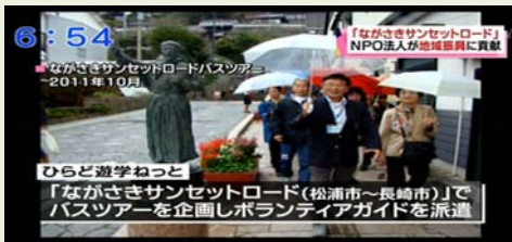
6:54 「ながさきサンセットロード」NPO法人が地域貢献に貢献 ひらど遊学ねっと 「ながさきサンセットロード(松浦市～長崎市)でバスツアーを企画しボランティアガイドを派遣