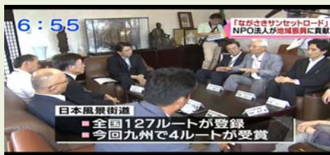
6:55 日本風景街道 ■全国127ルートが登録 ■今回九州で4ルートが受賞