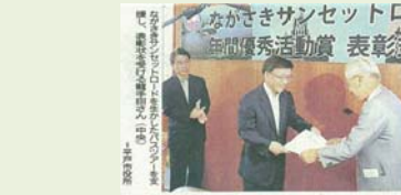
ながさきサンセットロード 優秀活動賞を受賞