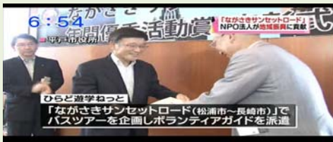
6:54 ひらど遊学ねっと 「ながさきサンセットロード(松浦市～長崎市)でバスツアーを企画しボランティアガイドを派遣