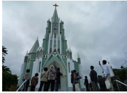
〈平戸ザビエル記念教会〉