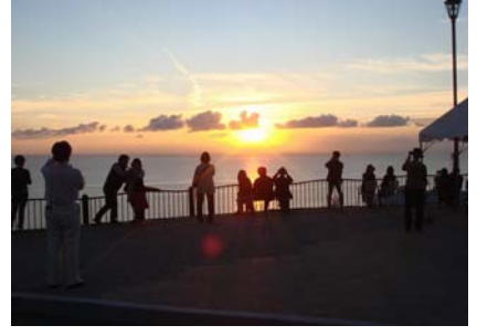
〈道の駅「夕陽が丘そとめ」から〉