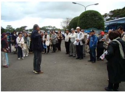
〈現地ボランティアガイドによる説明〉