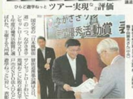
「ながさきサンセットロード」NPO法人が地域貢献に貢献