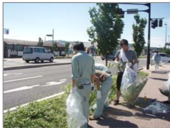
【清掃中の参加者の皆さん】