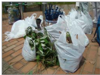
【1時間で20袋回収(草やゴミ)】