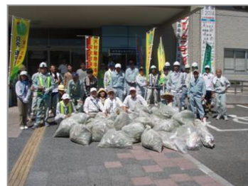
【多くのゴミ回収大変お疲れ様でした!】

平成24年8月4日(土)、マイツリー周辺の清掃・除草活動を実施しました。前回3月の清掃から約5ヶ月が経ち、植栽帯には雑草が伸びており、また、空き缶などゴミもある状態となっていました。今回の清掃活動には、マイツリー会員の皆さんはじめ市民の方々など約40人(前回35人)が参加して、植栽帯の清掃のほか、街路樹の周りに生えた雑草などを取り、道路をきれいにしました。当日は朝から30度を超す暑い中での作業で大変お疲れ様でした。今後も定期的にマイツリー活動が実施されますので、お近くの方は是非、ご参加してください。