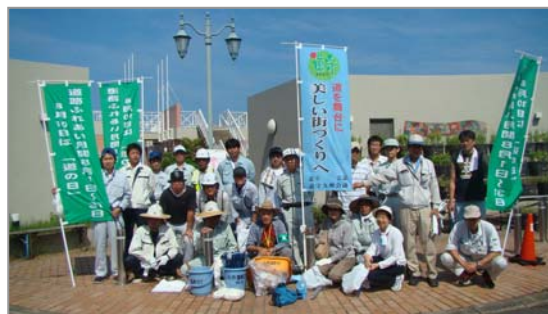
【暑い中、ご苦労様でした!】

当日は、30度を超す猛暑の中26名の参加者が二手に分かれて、小浜温泉街の道路のゴミ拾いに汗を流しました。日頃より、「小浜温泉57」の皆さんが清掃してあるため、当日は目立ったゴミも少ない中ではありましたが、雑草があり草むしりも精力的に行いました。参加者からは「年々ゴミは減っているけど、タバコや雑草は多いね」などの声が聞かれました。今年で、7年目の活動となりましたが、皆様の日々の活動により年々綺麗な道路が保たれております。また、1年前に植えたジャカラダの苗も順調に育っております。