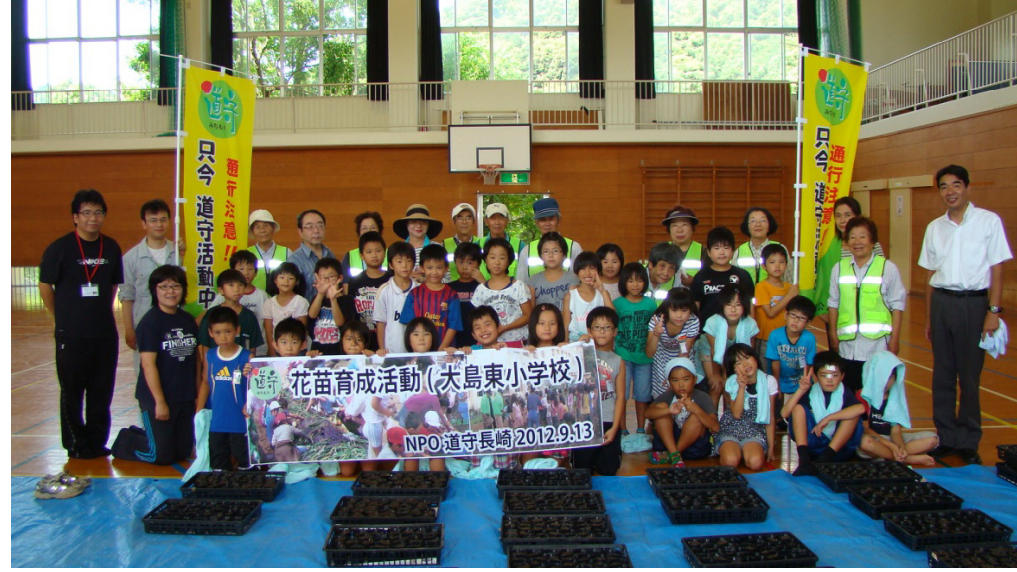
★作業後は参加者全員で集合写真を撮りました★

～児童(一部)の感想コメントを紹介します～ ○あつかったけど楽しかったです。はやくめがでるとうれしいです。さいた花をはやく見たいです。 ○たねまきをして早く花がさいてほしいなあと思いました。キンセンカがほかの学校やどうろにうめられたらうれしいです。 ○いっぱいできてよかったです。ほくたちがきれいにそだてたいと思います。