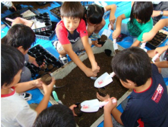
④ポットに土を入れ