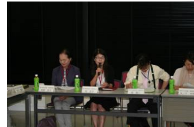
【活動を紹介される牧代表】