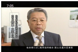
【佐世保ケーブルTVでも紹介されました】