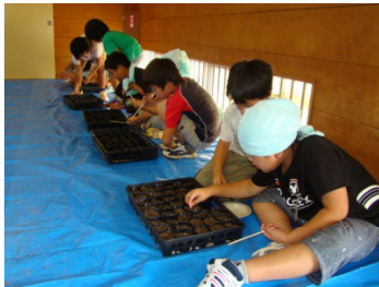
⑤、⑥最後に種をまき完了(1ポットに2、3個種をいれます)