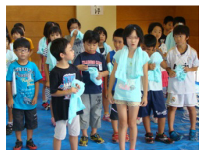
作業後、児童よりお礼の挨拶模様

◇アンケート結果 回答数29人(全員) ○約8割が花が好き ○今回種まきは、 ほぼ全員『楽しかった』 と回答