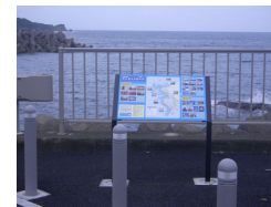
サンセットロード案内板の設置（長崎市）

眺望が良い場所で雑木などが生い茂っている場合は伐採を行い防草シートを設置したり、簡易パーキングに案内板やPR標識を設置するなどの取り組みも実施しており、地域を訪れる方が『ながさきサンセットロード』を楽しんでいただけるような『舞台づくり』を実施し、地域の魅力発信に努めてあります。