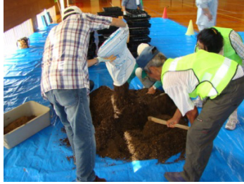
②道守のメンバーで土づくり