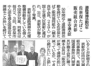
【9月1日西日本新聞記事】