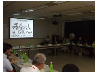
【昨年の佐賀のみちづくしの報告風景】