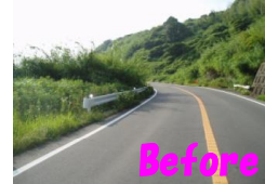
Before 防草シートの例（西海市大瀬戸町）

「ながさきサンセットロード」は、長崎県西部の美しい海岸沿いの道路をメインルートとしており、県の西海岸では、どこからでも広大な海に沈む美しい夕日を望めます。そこで、この地域を訪れた方に、安全で気軽に風景を堪能していただけるように、眺望が良い場所を選定（既存の道路敷地を利用）し、簡易パーキングを整備しています。