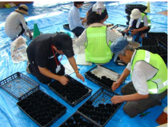
①児童が来る前にポットを並べ

今回、約2,000個の黒いポットに丁寧にキンセンカや葉ボタンなどの種をまきました。順調にいけば11月頃には花苗に成長するように、児童達や道守のメンバーの方々水やりなどお世話を行います。育った花苗は、町内の他校などに提供できるよう計画してあります。