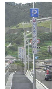
↓PR標識の設置 （長崎市柿泊町）

眺望が良い場所で雑木などが生い茂っている場合は伐採を行い防草シートを設置したり、簡易パーキングに案内板やPR標識を設置するなどの取り組みも実施しており、地域を訪れる方が『ながさきサンセットロード』を楽しんでいただけるような『舞台づくり』を実施し、地域の魅力発信に努めてあります。