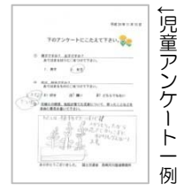
児童アンケート一例

～児童（一部）の感想コメントを紹介します～ ○わたしは、植物がだいすきです！人からもらったから花までからさずに水やりもがんばります。 ○わたしは、植えたなえは、他の学校の3年生が育てていたなえだから、大切に育てようと思いました。