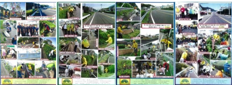
下段左より8月号 6月号 5月号 4月号

現在まで、清掃活動を131回開催されております。 参加者皆さんも「日本一きれいなまち」の意識も高まり、活動を継続されております。