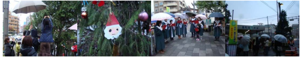
毎年恒例のクリスマスソングコーラスも好評でした (長崎バプテスト協会聖歌隊)