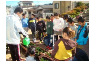
教頭先生より水やりの指導

○アンケート回答情報（長崎市稲佐小学校4年2組）参加者数15名、回答者数15名、回答率100%