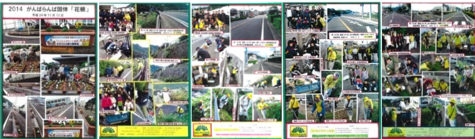
上段左より12月号(2枚) 11月号 10月号 9月号