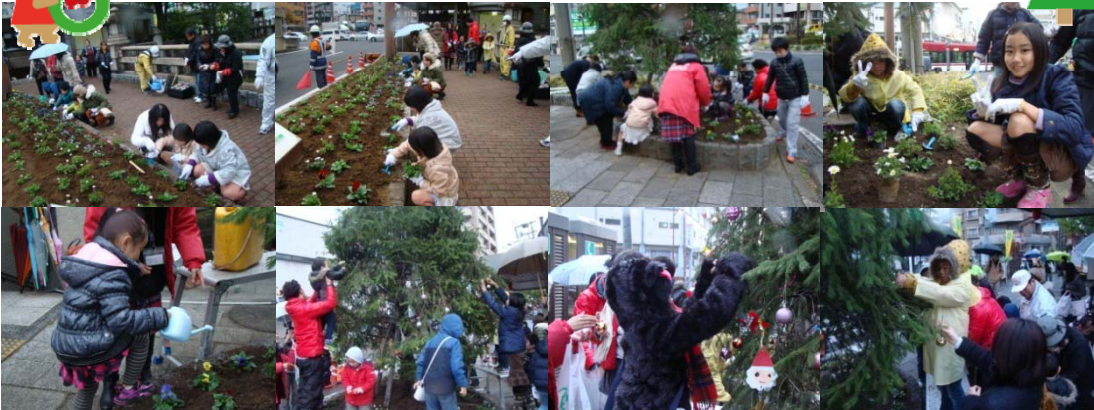
花植え～飾り付けの状況写真です

今回は雨の中での作業となりましたが、地域をきれいにしながら、地域のみなさまと楽しいひとときを過ごすことができました。