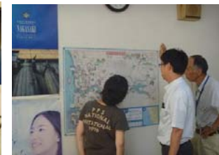
2.元図(更新前)マップの確認