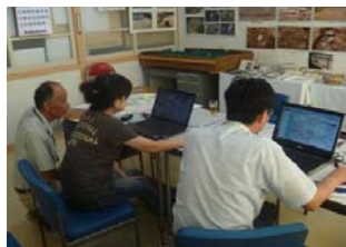
1.元図(更新前)データの確認

8月2日、通り名マップの元図(更新前)データをパソコン画面上にて、地元の方と案内板作成に向けてデータ確認を行いました。