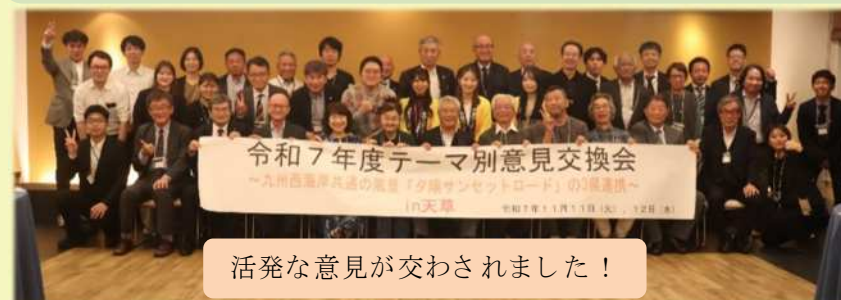
活発な意見が交わされました！

九州風景街道の夕陽を地域資源とするルート（長崎・熊本・鹿児島）において、ルート内外の連携強化、地域資源の活性化、回遊へ導く活動について意見交換会を行いました。