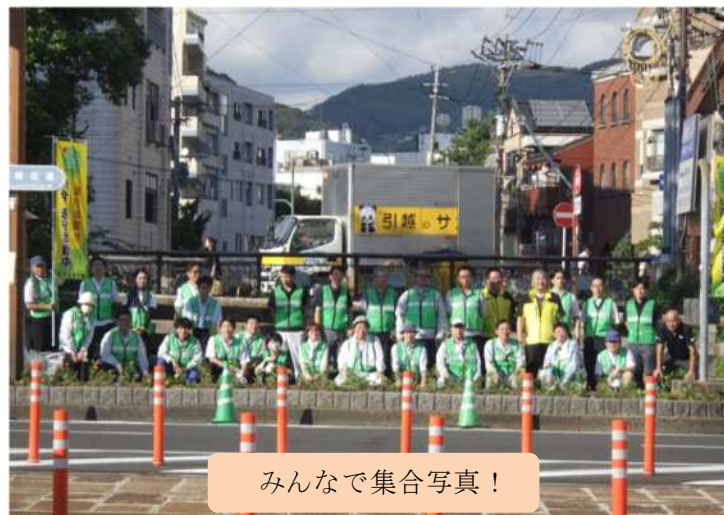
みんなで集合写真！