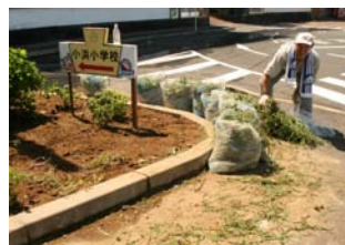
猛暑の中：雑草取り