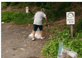
ポイ捨て多発箇所