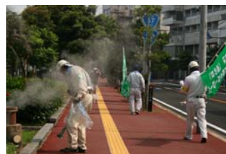
「道の日」小浜温泉街清掃活動