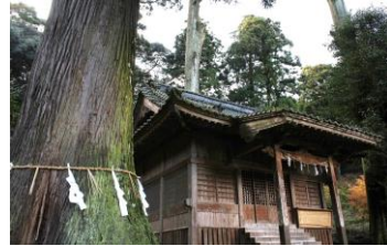
樹齢数百年の大杉と社殿

グリーンロードより国道389号を百花台公園へ向かう、狸の石像がある。右折、1km。橋を過ぎ左折、山手へ1.8kmで神社に着く。 うと 烏兔神社の祭神は大山祇命、摩利支天である。武神として島原藩主松平氏や藩士たちが崇敬した。本殿（神明造）奥の大石には馬に跨る武将が刻まれている。本殿に白衣観音が合祀されています。