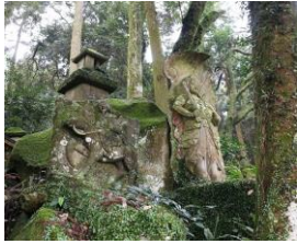
武将石像と不動明王像