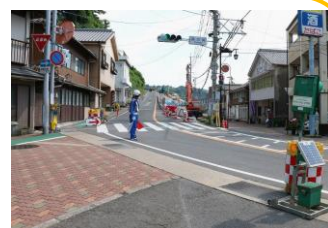
交通安全対策工事進む 平成29年6月14日