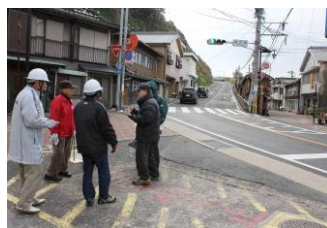
道の安全調査 平成25年12月20日

平成19年11月30日、第1回「道の安全調査」以来、調査の度、歩道が無い。市道から出るとき、雲仙から下って来る自動車が見えず危険。改良をと提案していました。 よう 漸く着工され、山の上、小浜中学校入口まで歩道が整備される計画です。