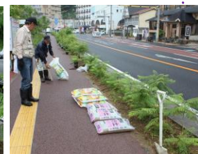
国道57号花壇 午前9時～