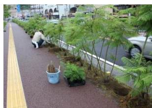
ジャカラダの苗を補植 6月24日（土）