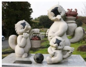
向いに名物の狸饅頭がある