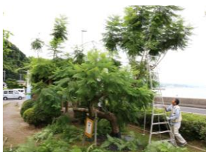
平成27年8月、台風15号で幹や枝が折れたことから、強風対策にジャカラダを剪定する 7月18日（火）午前8時30分～ 石合公園

7月定例作業 7月11日（火） 午後1時30分～ 除草とジャカラダの接ぎ木 8名参加 企業参加 小浜ガス