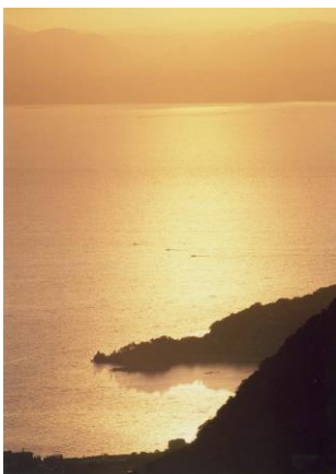
夕日に映える橘湾と弁天岬

別所ダム（総貯水量190万トン）の湖面に浮かぶかのように浄化センターとホテルが見えてくる。ここから、雲仙の地獄と温泉街は、約1 km。