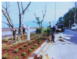
植え付け後 水まき

花壇にある2本のジャカランダ 2012年の小浜小卒業記念樹 初めて花が咲き 卒業生は喜んで いたのに 大寒波で幹まで枯れる 新芽の復活に期待しましょう