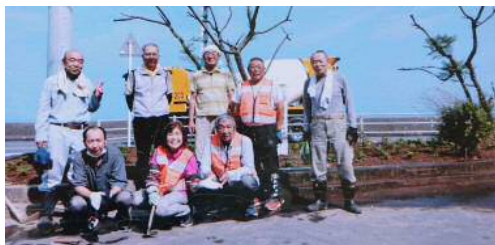
平松自治会のみなさん