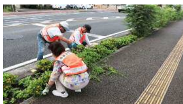
気温が上がる前に 早朝の作業