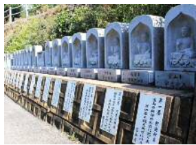
全行程 約1,460kmが 約50mに