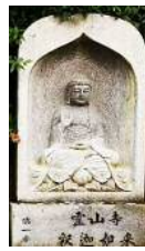
第1番 霊山寺 釈迦如来