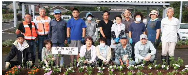
上野田自治会のみなさん