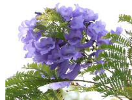
昨年 初めて咲いた ジャカランダ

花壇にある2本のジャカランダ 2012年の小浜小卒業記念樹 初めて花が咲き 卒業生は喜んで いたのに 大寒波で幹まで枯れる 新芽の復活に期待しましょう