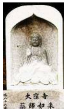
第88番 大窪寺 薬師如来