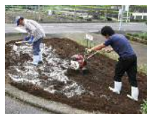
培養土・有機石灰撒布