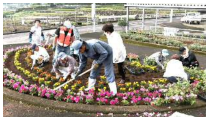
外周より 日々草・マリーゴールド・ペチュニアを植える