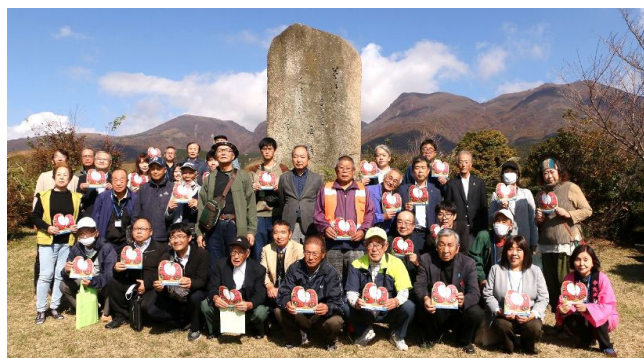
雄大な久住連山を背景に立つ 北原白秋歌碑の前で 竹田市の伝統工芸品「姫だるま」のシールを持って撮影 久住高原には 与謝野寛・晶子 徳富蘇峯 野口雨情など多くの歌人の碑がある

「小浜温泉57」環境美化&まちづくりのボランティア活動は 年会費1,000円で運営しています 活動にご参加いただける方と賛助会員を募っています ご協力をお願いします