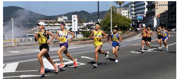
男子 鎮西学院 3年ぶり16度目の優勝 2時間9分51秒 2位 瓊浦 3位 創成館 (29校出場)

日本風景街道 「島原半島うみやま街道」 ~祈りと幸せをつむぐ殉教・霊場巡礼街道~ 島原半島 鎮西八十八ヶ所霊場 第二十九番札所 雲仙市小浜町南本町