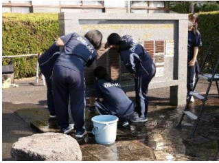
歴代の優勝校の銘板を磨き 校名を書く