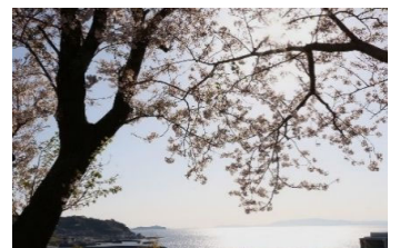
眼下に橘湾を一望