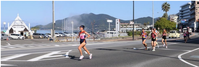
女子 諫早 5年連続22度目の優勝 1時間12分22秒 2位 長崎商 3位 鎮西学院 (21校出場)