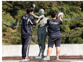
錆びないように 蜜蝋でワックスかけ