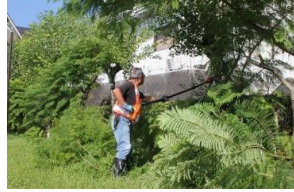
チェーンソーで幹を伐る