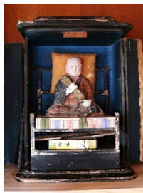
弘法大師・観世音菩薩・ 不動明王が祀られています