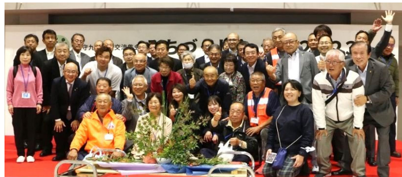
道守長崎会議のみなさん 小浜温泉57 4名参加