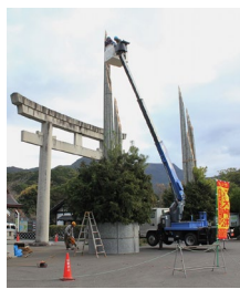
大門松 最後の仕上げ 12月17日