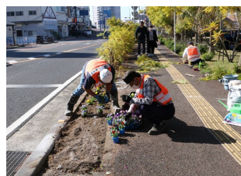
「マリン花壇」花植え・ジャカラダを剪定する