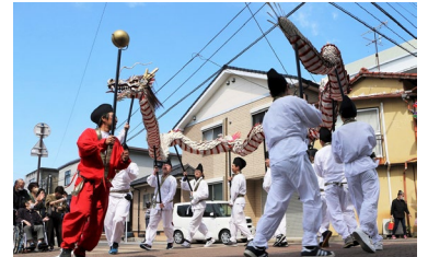
小浜温泉 湯まつり