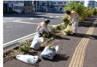
国道57号花壇の除草