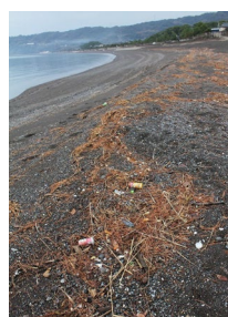
砂浜に漂着したゴミ