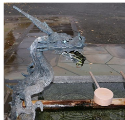
手水鉢の龍神 小浜神社・いのりの里(小浜町)・熊野神社(布津町)