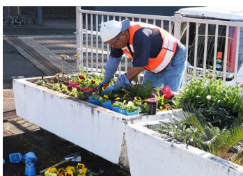
「フラワーポット」花植え 小浜町平松