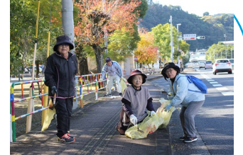
新浜老人会 国道251号を清掃