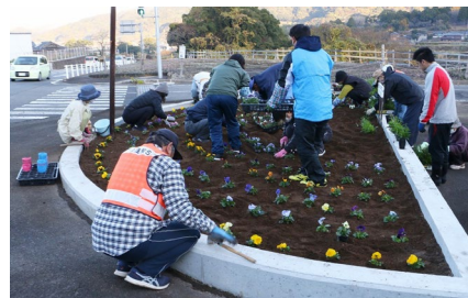
外側から パンジー・ピオラ・ ナデシコを半円形に植える