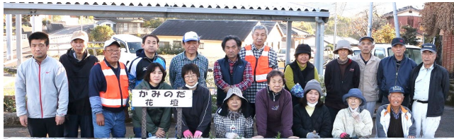
上野田自治会のみなさん