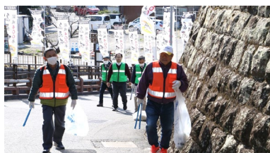
築城400年の島原城入口