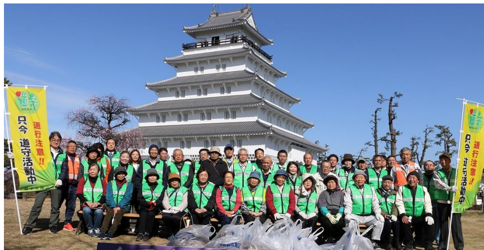
島原城をバックに 参加50名 小浜地区より 宅島建設・小浜温泉57 7名参加