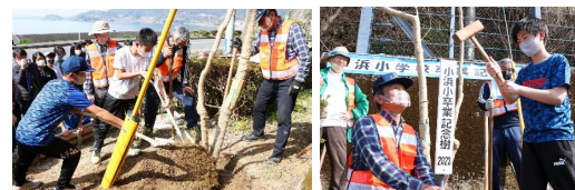
昨年3月10日の 記念植樹