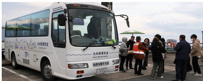
大分「自然を愛する会」の九州風景街道バス 九州各県の名所がラッピングされています