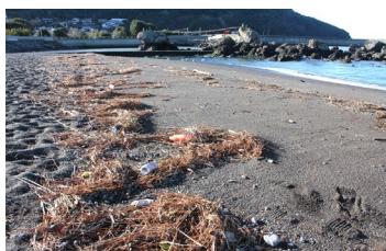
波で打ち上げられたゴミ