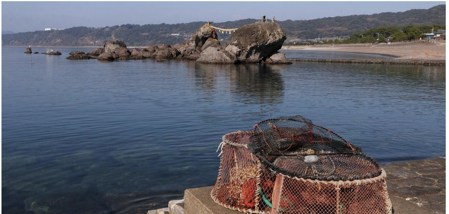
日本風景街道 「島原半島うみやま街道」 千々石海岸 福石

地震で亡くなられた方のご冥福と 被災されたみなさまへ 心からお見舞い申し上げます