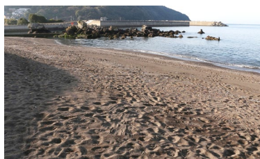
きれいに清掃されていました 2月18日