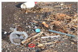
砂浜に漂着したゴミ