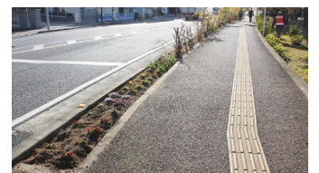
きれいになった 花壇と歩道

「小浜温泉57」環境美化&まちづくりのボランティア活動は 年会費1,000円で運営しています 活動にご参加いただける方と賛助会員を募っています ご協力をお願いします