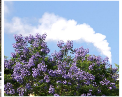
ジャカラングと湯けむり 小浜マリンパーク