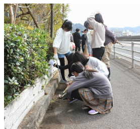
歩道の草取りと落葉の清掃