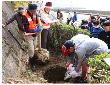
掘った穴にポラス土を入れる