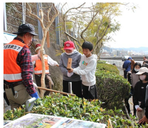
卒業記念樹の表示板を打ちこむ