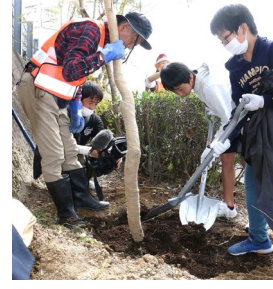
根の周りに有機培養土を入れる