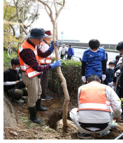
ジャカランダを入れる