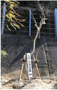
植えた卒業記念樹