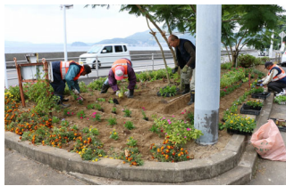
小浜地区 平松なかよし花壇・マリン花壇 花植え 7月・12月