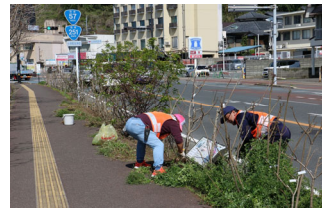
国道57号マリン花壇除草・ジャカラング剪定 (定例作業 毎月第3火曜日)