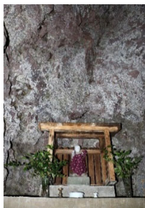
子を抱く子安弘法大師