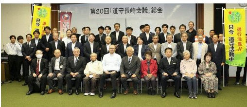
道守長崎会議総会 5月16日