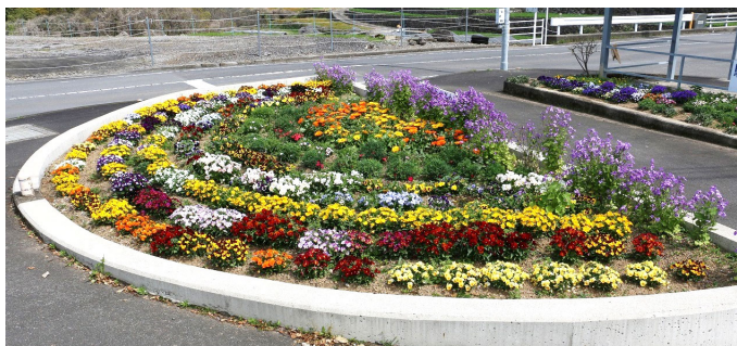
紫花菜・金盞花・撫子・パンジー・ピオラ