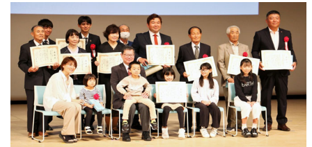
道守九州会議交流会 みちづくLin延岡2025 10月23・24日