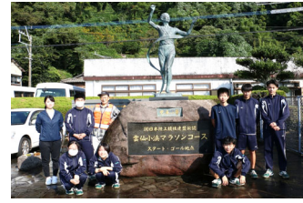
「完走の華」洗浄 小浜高校生と 10月27日 高校駅伝スタート地点