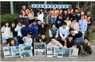
小浜小卒業記念ジャカラング植樹 3月3日