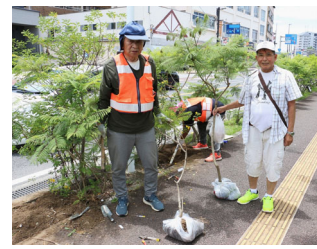
ジャカラング掘り出し販売 道路協力団体事業