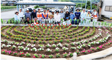
千代石地区 かみのだ・ピープル前・3分団前花壇 花植え 7月・12月