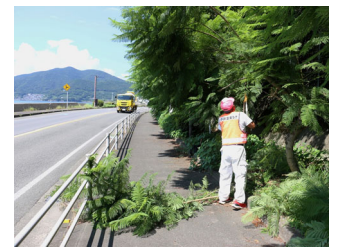
ジャカラング剪定 赤崎緑地帯