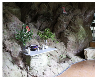
観音堂の床板は 岩に合せて張られている