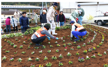
国道57号「かみのだ花壇」 12月