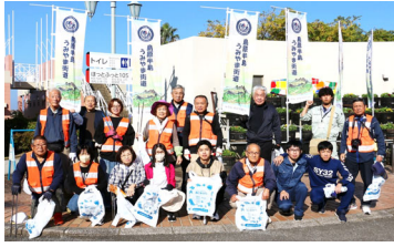
島原半島うみやま街道一斉清掃 11月15日 温泉街清掃