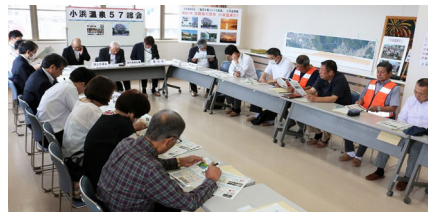
小浜温泉57総会 6月3日