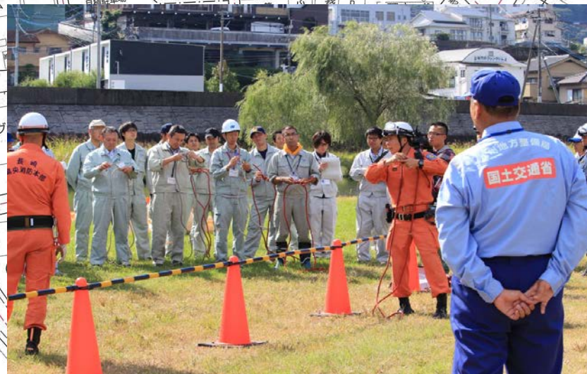
【昨年度;ロープ結索訓練の状況】