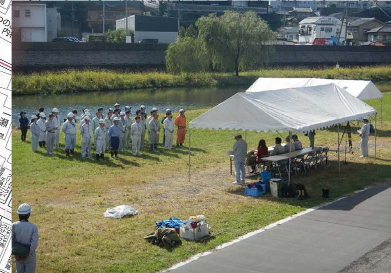
【昨年度;訓練(全体集合)の状況】