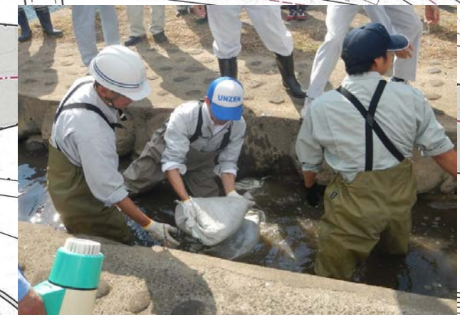
【昨年度;土のう積み訓練の状況】