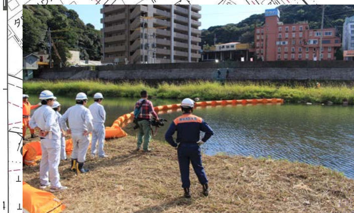
【昨年度;オイルフェンス敷設訓練の状況】

※本明川水質汚濁対策連絡協議会とは 国土交通省、農林水産省、長崎県、諫早市、雲仙市、諫早消防署、小浜消防署、諫早警察署及び雲仙警察署の各機関で構成されています。