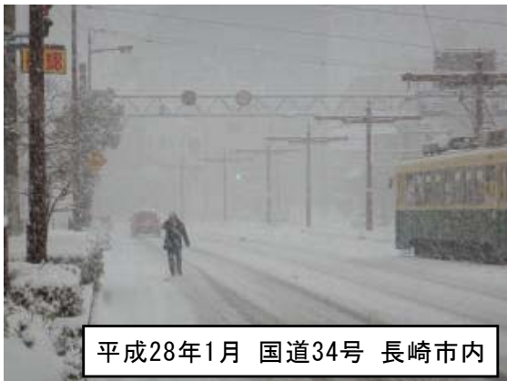
平成28年1月 国道34号 長崎市内