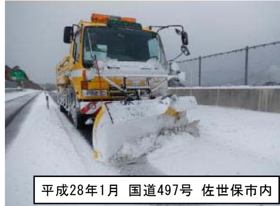
平成28年1月 国道497号 佐世保市内