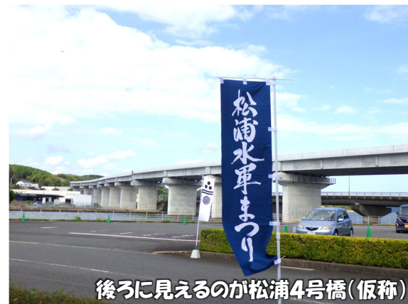
後ろに見えるのが松浦4号橋(仮称)