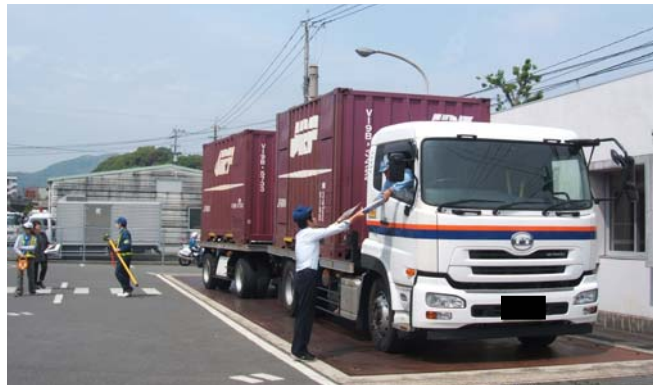
特殊車両取締り風景