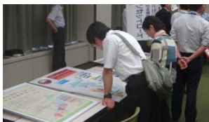
長崎県風景街道「ながさきサンセットロード」をPR