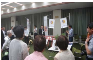
小浜地区の屋台では、ポイ捨て防止の「護美之神」鳥居を披露

毎年恒例の「屋台村」も行われました。この情報交流会(屋台村)とは、各地・各団体の取組みを屋台形式で紹介するもので、今年は5団体がブースを設け、活動のPRが行われました。道守活動で出た雑草などを堆肥化し、収穫した野菜が紹介されるなど、各地の取組みの様子が紹介され、大盛況の中閉会しました。