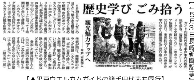
【▲平戸ウェルカムガイドの籠手田代表も同行】