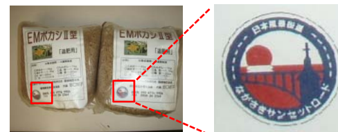
【▲ロゴマークを添付】

西海地区の屋台では、生ゴミ処理剤の表紙に風景街道「ながさきサンセットロード」のロゴマークを付けてあり、認知度向上へ取り組まれてあります。