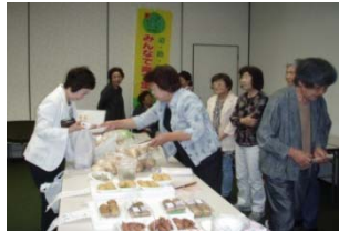
西海地区の屋台では、生ゴミ処理剤など環境にやさしいリサイクル品を紹介