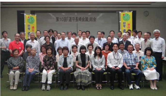
最後に参加者の集合写真を撮りました。次回は、11月1日の『みちづくし』でお会いしましょう。