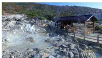
④雲仙温泉と地獄(雲仙市)