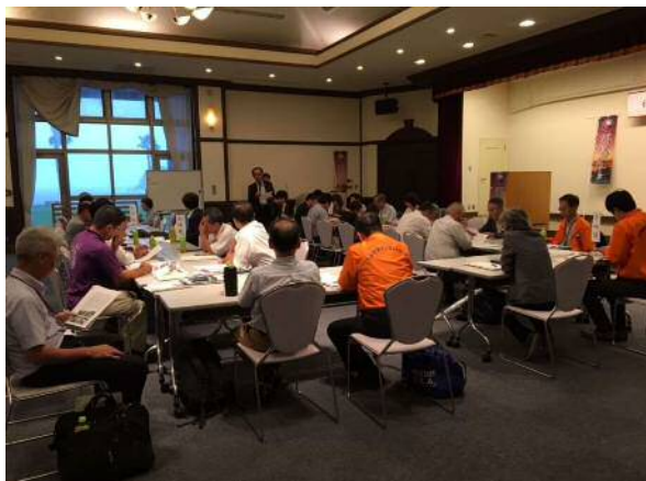
3ルート合同バスツアー 情報交換会の様子