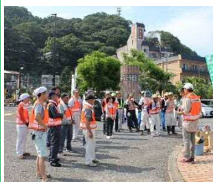
道守による清掃活動の様子