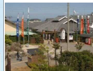
⑧「道の駅」みずなし本陣ふかえ(南島原市)