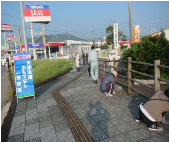
天草市瀬戸町周辺での取組の様子