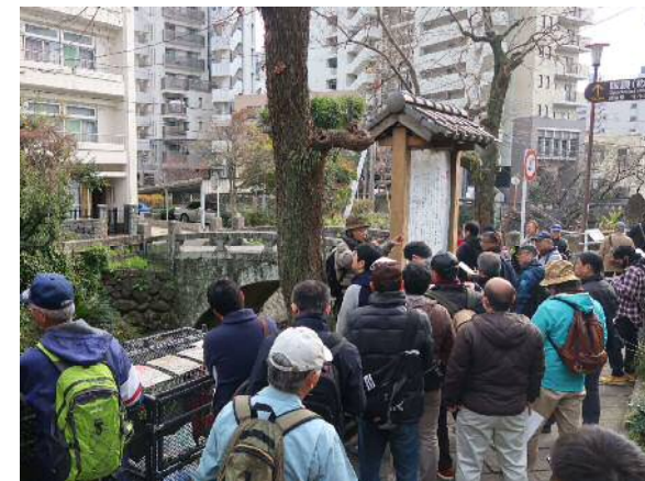
道の語り部養成講座の様子