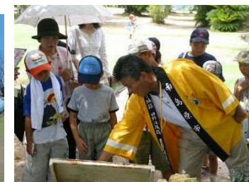
地域資源のガイドの様子