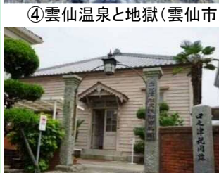
⑩口之津歴史民俗資料館(南島原市)