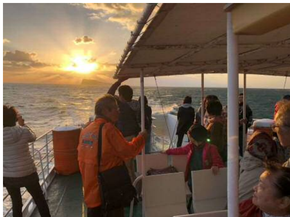
外海グリーンツーリズム・サンセットツアー クルーズの様子