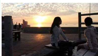
③足湯『ほっとふっと105』(雲仙市)