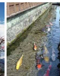
⑥鯉の泳ぐまち(島原市)