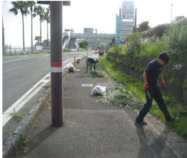
「道の駅 有明」周辺での取組の様子