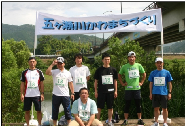
五ヶ瀬川かわまちづくりのPRも行いました。