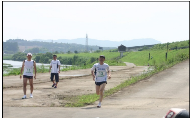
暑さに負けず力走してます。