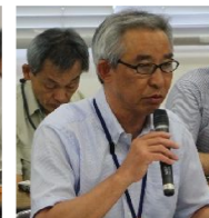
延岡土木事務所長