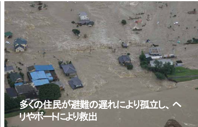
多くの住民が避難の遅れにより孤立し、ヘリやボートにより救出