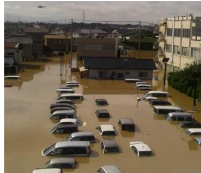
常総市役所から駐車場を撮影(撮影日:9/11) 周辺は浸水し、防災拠点の市役所も孤立化。