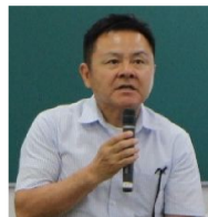
延岡河川国道事務所長