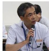
宮崎地方気象台長