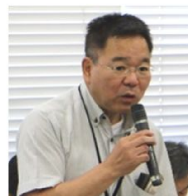
延岡河川国道事務所