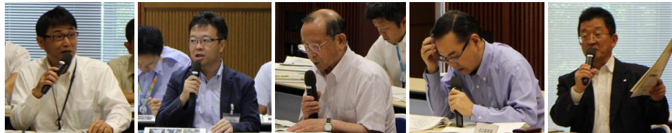
西臼杵支庁長 延岡市長 高千穂町副町長 日之影町長 五ヶ瀬町長