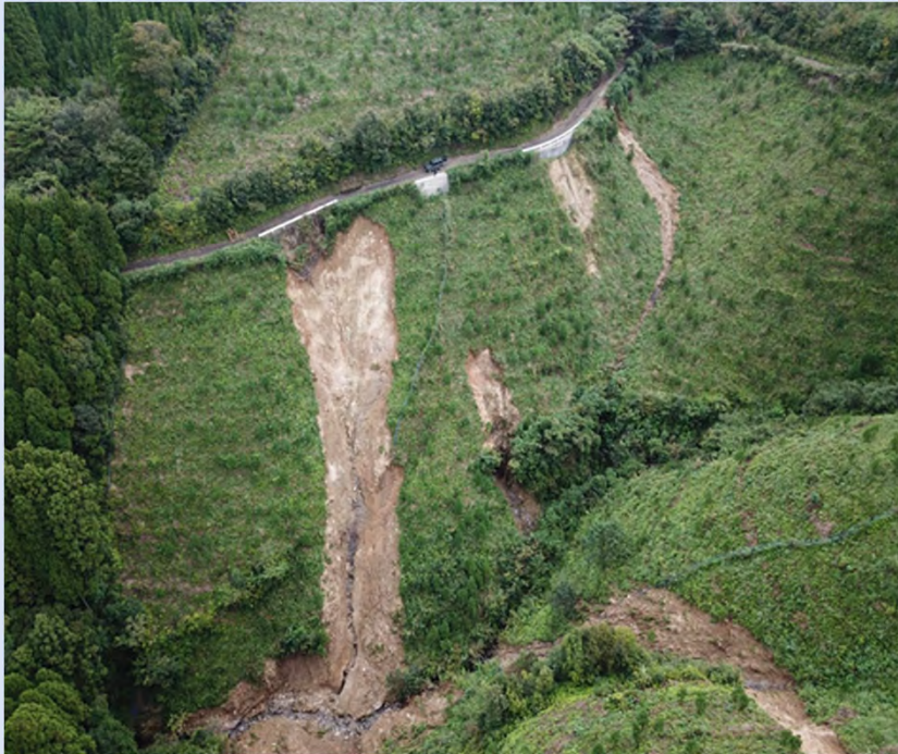
山腹崩壊の被災状況