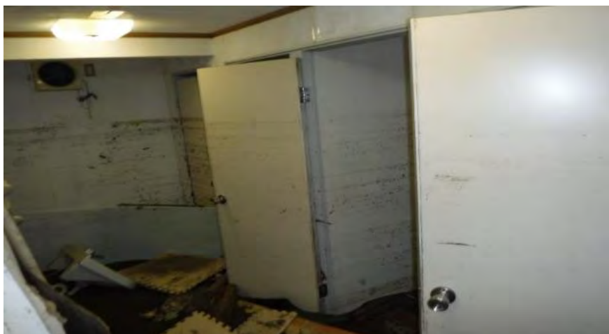
・押方地区床下浸水