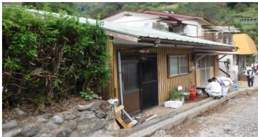
・向山秋元地区床上浸水①