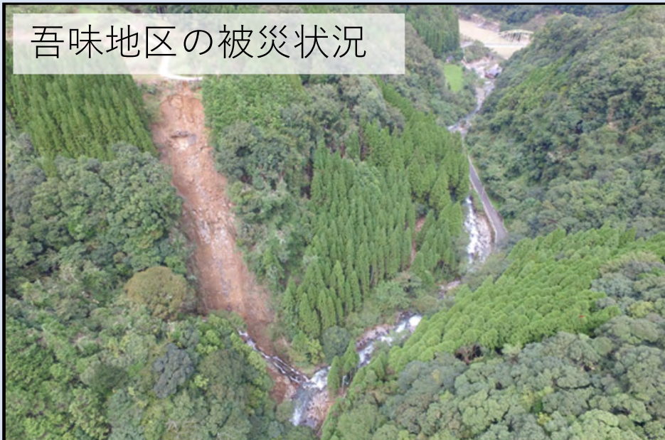
吾味地区の被災状況