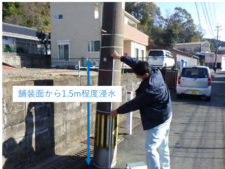
富美山地区の被災状況