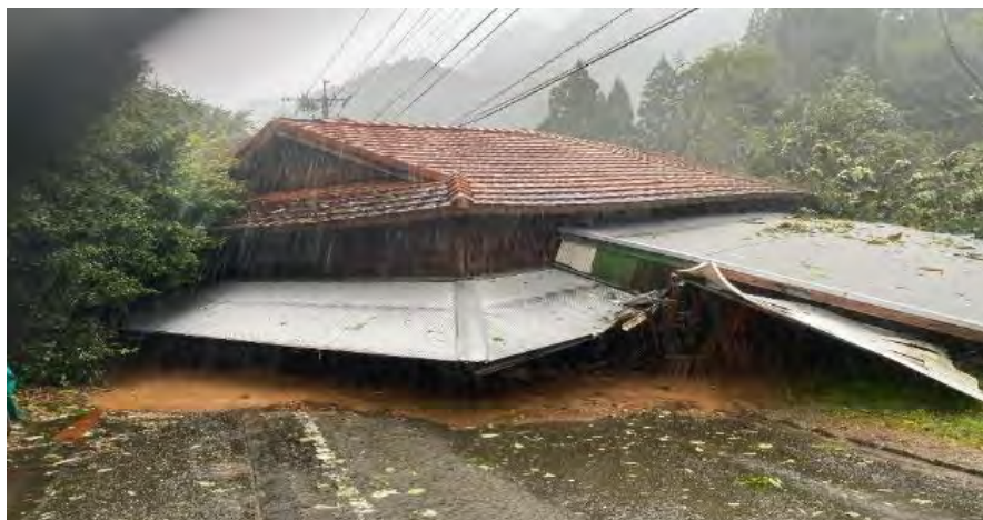
・岩戸地区牛舎倒壊