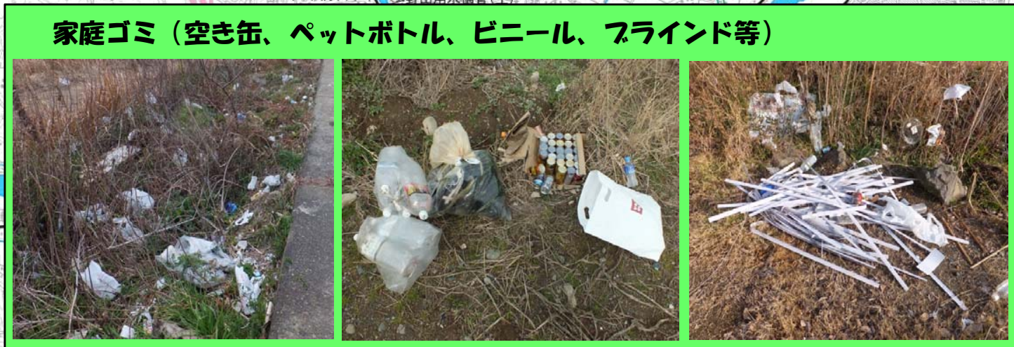
家庭ゴミ(空き缶、ペットボトル、ビニール、フライド等)