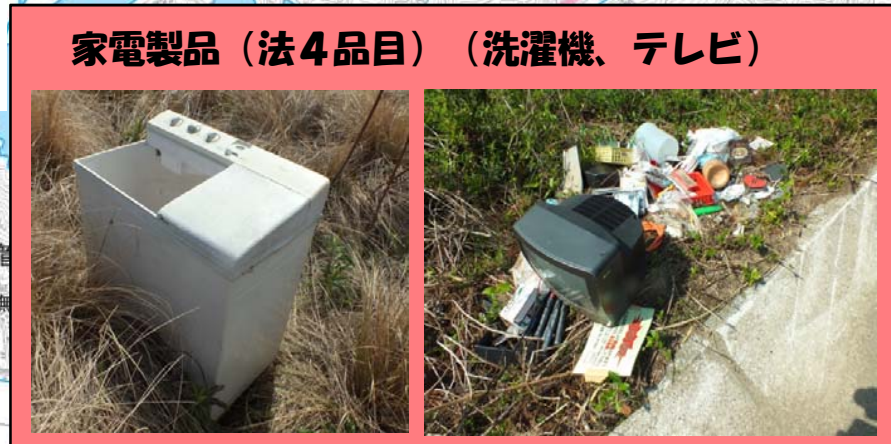
家電製品(法4品目)(洗濯機、テレビ)