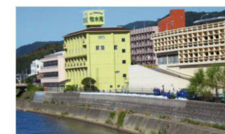
土のう積み演習(北小路地区)