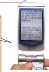
延岡市防災メール受信(イメージ)

7月には防災ハザードマップを公表しています。普段からの備えと併せ、これらの情報を有効に活用することにより、地域防災力の向上に役立てましょう。