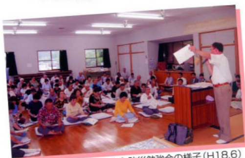
自主防災勉強会の様子(H18.6)