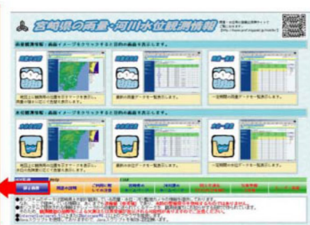
宮崎県の雨量・河川水位観測情報ページ