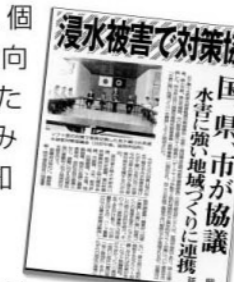
夕刊デリー 平成17年11月29日

激特事業採択から約1年経った現在の状況を知り、個人・地域の防災力向上に役立てていただくため、取り組みと進捗状況をお知らせします。