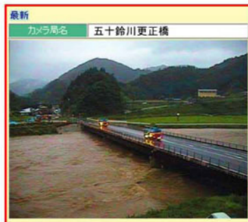
河川カメラ画像(五十鈴川更正橋)