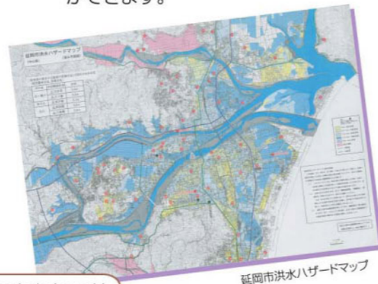
延岡市洪水ハザードマップ

宮崎県防災・防犯情報メールサービス(携帯)登録先 https://www.fastalarm.jp/miyazaki